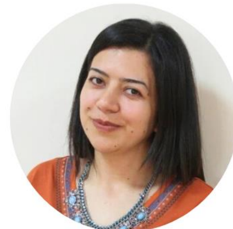
Հայկունի Աղաբեկյան Թարգման (ֆրանսերէն)