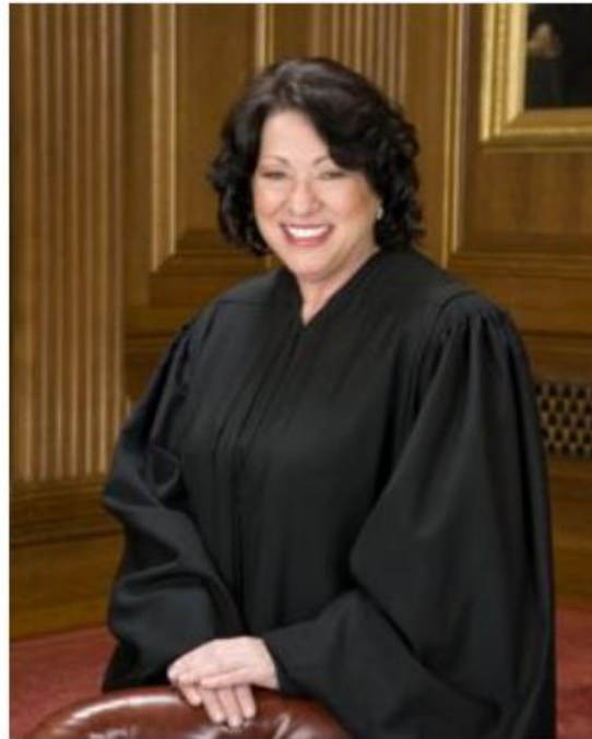
Կարապետյան Կարինե Դատավոր