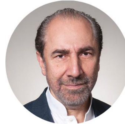
Կարօ Արմէն Նախաձեռնող